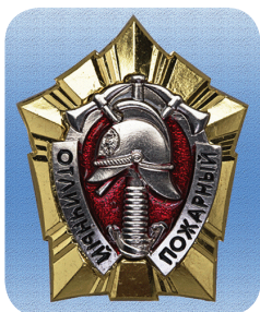
Нагрудный знак «Отличный пожарник», СССР, 1944-1970 г.г.

На работе бойцы вели трезвый образ жизни, но был у меня курьер, мусульманин, молодой, но горький пьяница. Ходил с гордо задранной головой, ни с кем не здоровался. Эфиопы почему-то его увольнять не хотели, но необходимо было чего-то делать. Однажды, когда он после запоя вышел на работу, я, ни слова не говоря, посадил