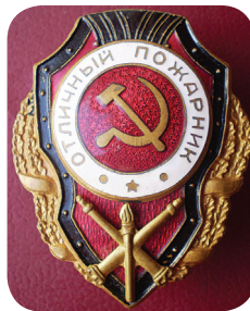
Нагрудный знак «Отличный пожарник», СССР, 1944-1970 г.г.

Не раз приходилось собирать консилиум из советских специалистов для решения проблем такого характера. Приплыл наш корабль ро-ро, ну это там где машины своим ходом загружаются и