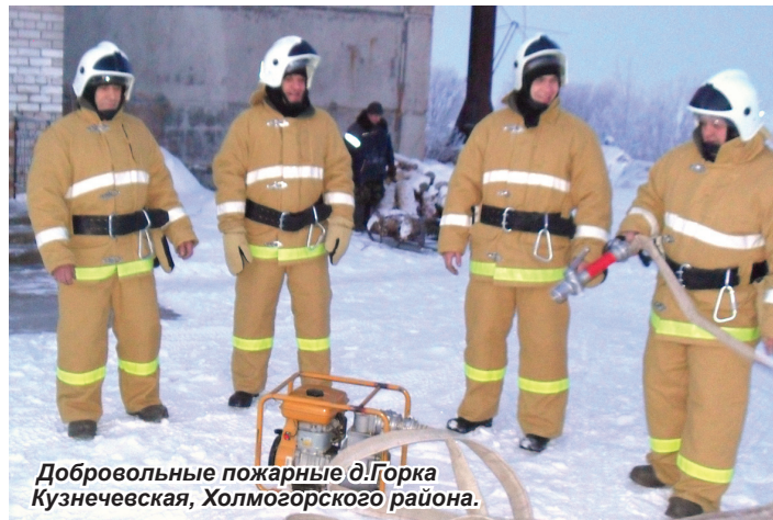
Добровольные пожарные д/Горка Кузнечевская, Холмогорского района.

чинения им увечья или в случае гибели (смерти) добровольного пожарного;